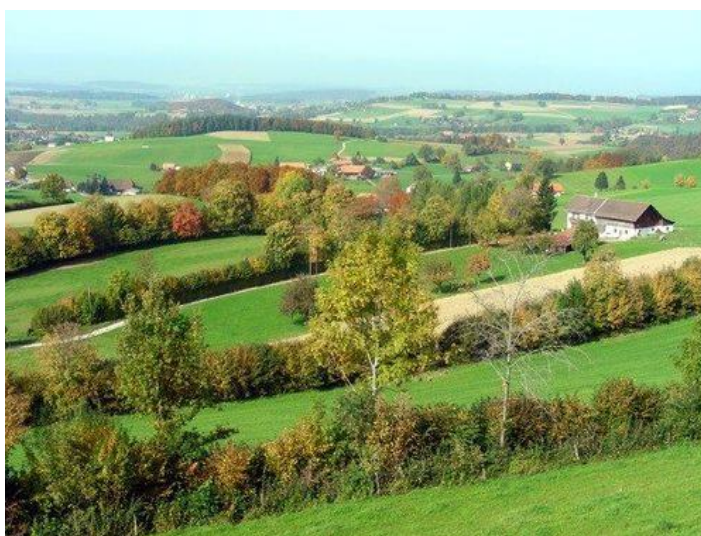
A gauche, allée d'arbres ; à droite, haies