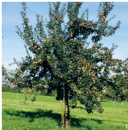
A gauche, verger ; à droite, arbre fruitier haute tige