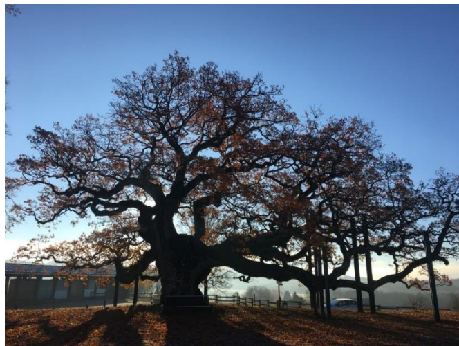
A gauche, arbre isolé ; à droite : arbre remarquable (chêne de Morrens)