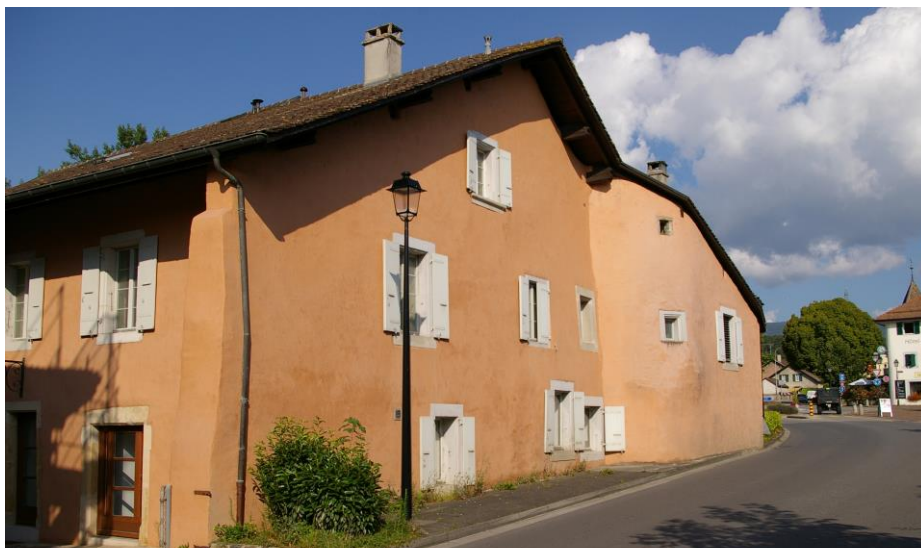
La partie de l'immeuble du Tilleul bordant la route de Gland doit être complètement rénovée.

Sur la base de la Feuille de route établie pour la législature 2016-2021, la Municipalité a identifié les projets qu'elle désire concrétiser d'ici la fin de la législature. Les principaux font la part belle aux rénovations et aux sportifs et enfants de la commune !