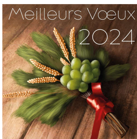
Artiste: Emily Wulf, Vich

Plus d'information : regiondenyon.ch/consultation-srgza