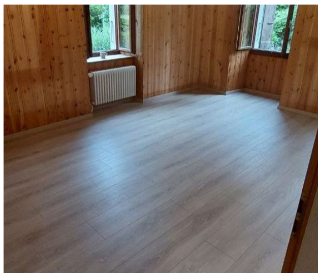
Exemples de réalisations par Woodbe

Vous pouvez retrouver toute la liste des services sur le site internet https://woodbe.ch