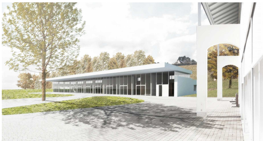
Concept architectural préliminaire du bureau éo architectes SA à Lausanne

Suite au crédit octroyé le 6 décembre 2016 par le Conseil général, la Municipalité a lancé une procédure soumise à la législation sur les marchés publics en vue de la réalisation d'un bâtiment multifonction aux Pralies comprenant une UAPE, une cantine de 80 places avec cuisine équipée pour la régénération des repas et une salle polyvalente de 100 places assises avec une scène mobile. Cette procédure a abouti au choix d'un concept architectural préliminaire et d'un groupement pluridisciplinaire de mandataires. Sur 10 offres rentrées, c'est le projet d'éco architectures SA qui est ressorti très largement de l'analyse multicritères menée par le Comité d'évaluation composé de professionnels externes, de représentants de la Municipalité et du président de la Commission des bâtiments du Conseil général.