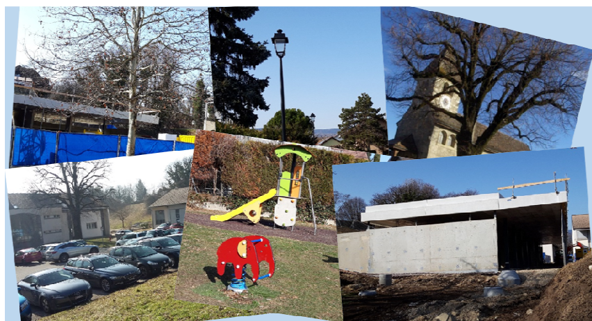
Une année sous le signe des bâtiments communaux, des espaces détente et de l'énergie.

Sur la base des quatre axes prioritaires définis dans sa Feuille de route pour la législature 2016-2021, la Municipalité a identifié les projets qu'elle désire concrétiser en 2019. En voici les principaux.